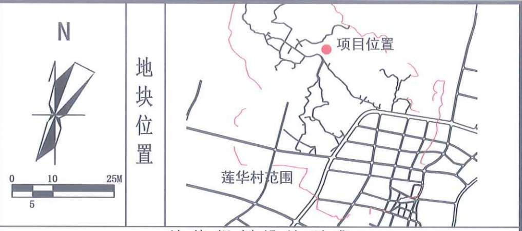
地块规划设计要求